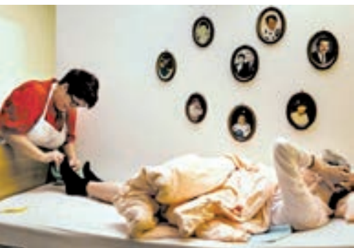
Immer mehr Menschen in Deutschland sind alt und gebrechlich. Das Pensum der Pfleger steigt.

Hinter den Namen verbergen sich mächtige Investoren aus dem Ausland. Sie stecken Milliardenbeträge in deutsche Altenheime und hoffen, dass sich die Milliarden vermehren. Lange Zeit war das in Deutschland nicht möglich; die Heime wurden von Kirchen und vom Staat betrieben. Anfang der neunziger Jahre öffnete die damalige Bundesregierung die Pflegebranche für Privatunternehmen. Heute ist von den mehr als 10.000 deutschen Altenheimen etwa die Hälfte in privater Hand, und ihr Anteil wird von Jahr zu Jahr größer.