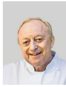
Alfons Schubbeck ist einer der berühmtesten Köche Deutschlands. Er leitet unter anderem die Städtler Stuben in München und ist Mannschaftskoch des FC Bayern