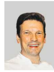
Christian Jürgens hat im Restaurant Überfahrt am Tegernsee drei Sterne erkocht und zählt zu den Stars der deutschen Spitzgastronomie